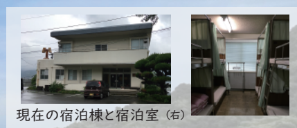
現在の宿泊棟と宿泊室（右）